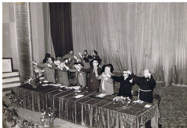
I convegno Regionale del Lazio – 15.02.1981

finiva verso le 21....! Ma non era finita! Cominciavano allora i gruppi per pregare sulle persone.... Si faceva a gare per poter partecipare a questi gruppi di preghiera che imponevano le mani e pregavano... Veramente il Signore era presente ed attraverso i fratelli ti parlava. Io personalmente posso testimoniare che grazie a queste preghiere il Signore mi ha toccato il cuore perché leggeva nel mio cuore ....!